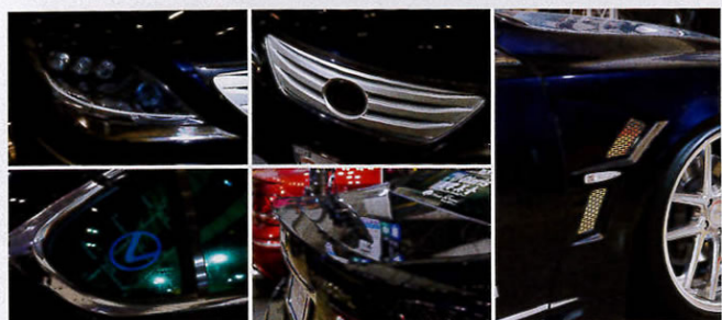
目頭を延長するようなシャープなアンダーアイライナー。600中期風グリルは前期枠&中期エンブレム(別売)に対応。1cmワイド化できるフェンダーキットもあり。ELシートは自由なデザインにオーダー可能。ハネはあえて大きめに。