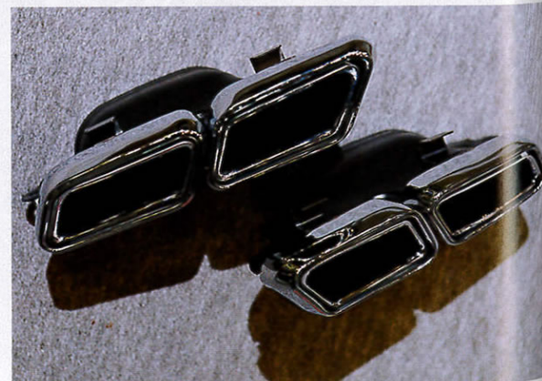
センスの定番モデル・リヴォルバーに90φが追加。リヴォルバーRSも含め、今後は90φ/100φで展開する(右上)。テールエンドを好きなカラーに染めるオプションサービスを開始。詳しくは問い合わせ(右下)。バンパー埋め込み式の新作・ディアマデュラ(左)。