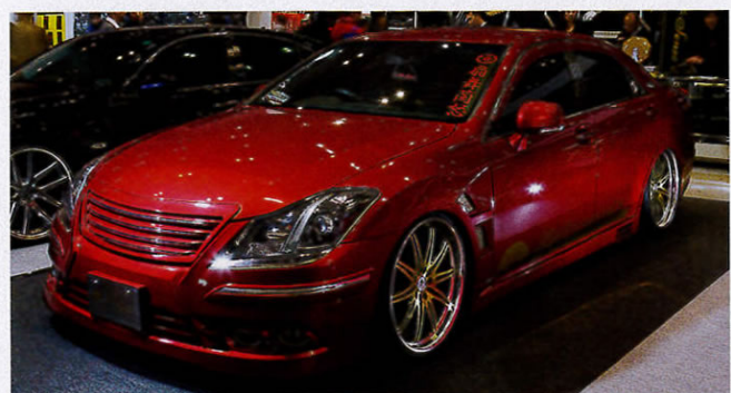
昨年秋にデビューした200クラウンも展示。主張し過ぎないスピンドルラインが見どころ。マフラーは高響美音を装備。