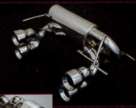
ソロII (S660専用) 価格 13万9320円 内部にパンチング処理を施した人気のソロは、今回 S660のために構造を見直して新開発。細部まで質感を追求したコースチアモデル。エアロ塗装済み品はそれぞれプラス1万9440円