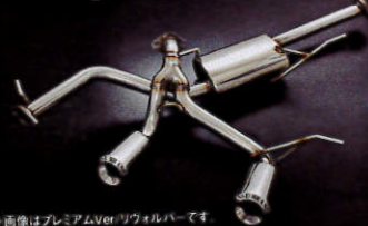
※画像はプレミアムVer.リヴォルバーです。