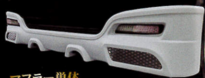
※画像はN-WGNカスタムです。