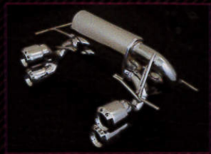
リヴォルバー 価格 19万3320円 本体 7560円 切り文字 1本 同社のイチ押し。リヴォルバーはコンパクトなボディとのバランスが良い90度。テールエンド先端に切り文字加工できるのも大きなポイント